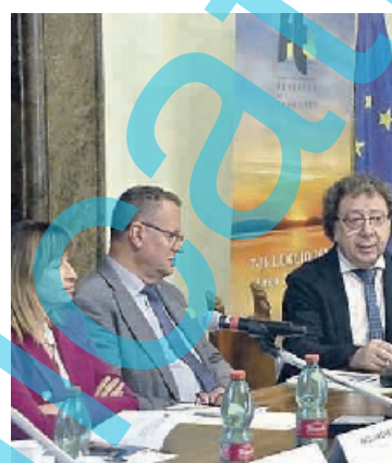
Un momento della presentazione del festival

Le attività? Tantissime, suddivise in tre principali aree di interesse: gusta, ammira, vivi. I protagonisti, nemmeno a dirlo, saranno artisti di strada, attori, musicisti, ballerini, sportivi e chef. Tra le attività degustazioni in stile street food, aperisup, crociere sul lago e percorsi di trekking, turismo in