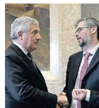
Sopra un momento dell'evento di mercoledì. A fianco, il ministro degli Affari Esteri, Antonio Tajani con il rettore Valerio De Cesaris

paese, ed in particolare di quello dell'Università per Stranieri di Perugia - scrive il Ministro -, quale «storica realtà umbra che gode di una reputazione di primo piano nell'insegnamento della lin-